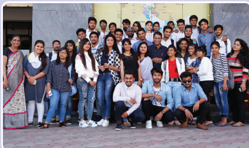
Mass Comm student visited Dainik Bhaskar printing press.