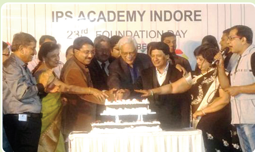
IPS Academy celebrated 23rd Foundation Day on 7th November, 2016.