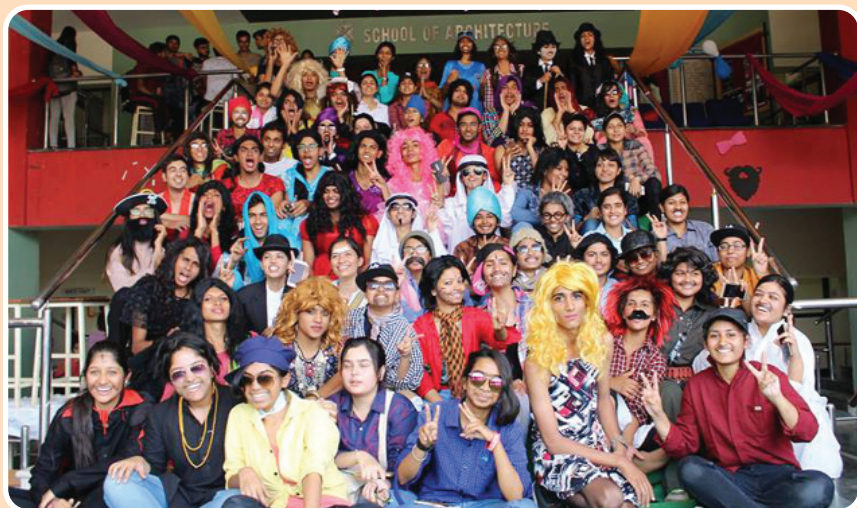
School of Architecture: Cross gender Theme in Mad Week.